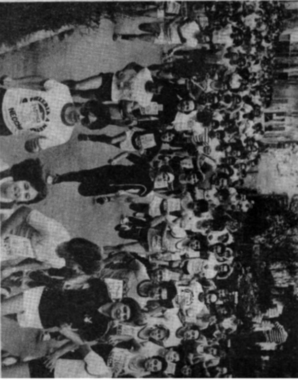
Si stanno predisponendo i particolari della 5° podistica che tra una settimana svolgerà a Povegliano su percorsi di 8, 15 a 42 chilometri. Iscrizioni al gruppo Bristol, telefono 80026. La podistica rientra nel "criterium 112", che compie 40 km, in programma oggi ad Orsago) e il giro della piana di Seravezza (Studio 101) i partecipanti, l'anno scorso, alla partenza.